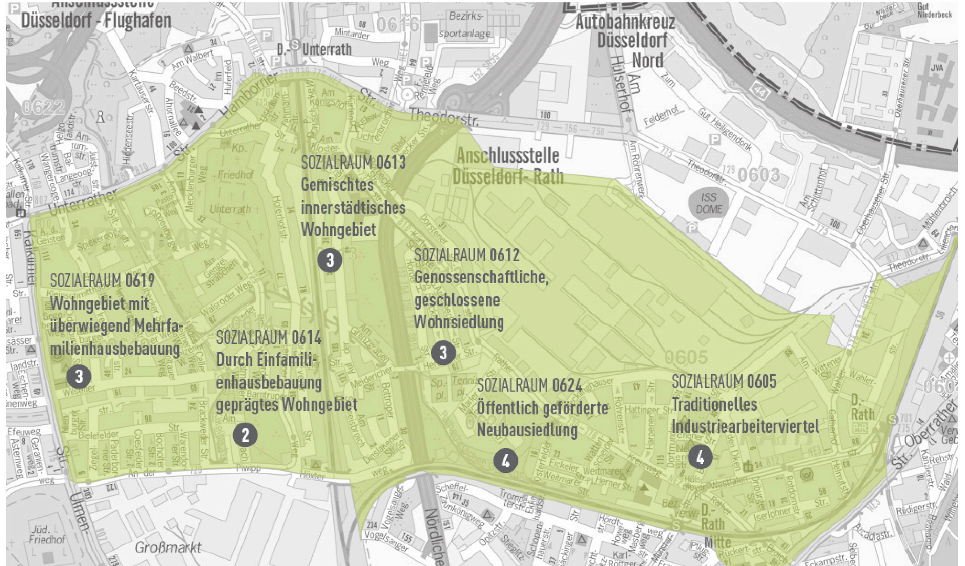
Darstellung des LUST-Gebiets, welches sechs repräsentative Sozialräume umfasst

Die Auswahl des zu untersuchenden Gebietes erfolgte auf Basis vorhandener Datenbestände der Stadt Düsseldorf und orientierte sich an der sozialräumlichen Gliederung der Stadt Düsseldorf. Das ausgesuchte Gebiet ist dabei repräsentativ und durch seine typische Struktur sowohl übertragbar auf andere Stadtteile in Düsseldorf als auch auf andere Städte. Das LUST-Gebiet befindet sich im Düsseldorfer Norden. Es umfasst Teile der Stadtteile Rath und Unterrath, welche in ihrer städtebaulichen, energetischen und sozialen Struktur eine große Vielfalt zu bieten haben.