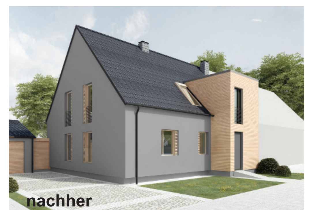
Visualisierungen von Energieausweisen, Bestand und Entwurf von Studierenden der HSD, Fachbereich Architektur

Innerhalb des Sanierungsmanagements wird großer Wert auf die Mitwirkung von Bewohner_innen gelegt. So wurde eine aktivierende Befragung mit folgender Intention durchgeführt: Bedarfsermittlung der Bewohnerschaft, Präsenz zeigen vor Ort, Aktivierung bzw. Kontaktaufnahme zu interessierten Personen sowie Informieren und Sensibilisieren. Hier wird deutlich, dass sich das Quartier durch eine enge Verbundenheit der Befragten mit dem Stadtteil auszeichnet und dass diese bereits Maßnahmen zur Energieeinsparung umsetzten. Neben Freizeitangeboten wünschen sie sich auch, entsprechend der Zielsetzung des Sanierungsmanagements, Maßnahmen im Bereich Energie und Umwelt, wie Angebote zum Nachhaltigen Konsum.